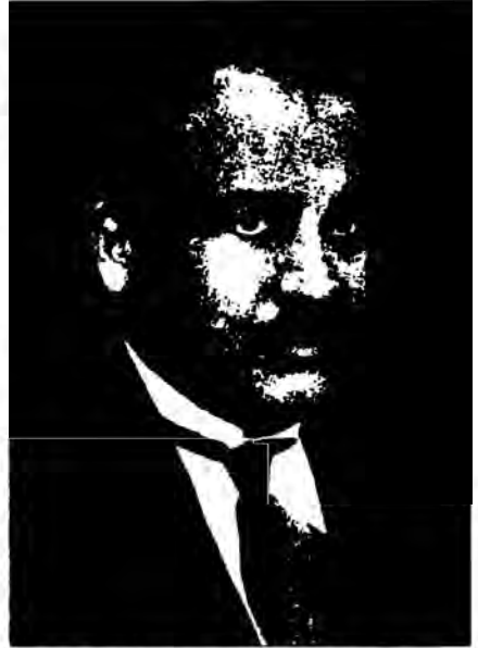
Türk milliyetçi düşüncesinin önemli isimlerinden Ziya Gökalp (1876-1924), korporatizmi savunurken özellikle siyasi partilerin temsiline önem veriyor, toplum içinde bireylerin "hak yerine vazife" düsturuyla hareket etmesini istiyordu.

Genel bir değerlendirme ile korporasyonların çok temelde devletten yasal düzeyde ayrı olmakla birlikte yarı-resmî çalışan ve kamusal düzenlemelerde yetkili merciler ile beraber davranan organizasyonlar olduğu düşünülebilir. Çoğunlukla üretim ve istihdam koşullarının tümünü tayin ve denetim ile yükümlendirilen korporasyonlara üyelik genellikle zorunludur. Üyeleri üzerinde yaptırım gücüne sahip olan korporasyonlar, sermaye ile emek arasındaki problemleri çözecek/üstünü kapatacak şekilde kurumsallaştırılmak istenmiştir.